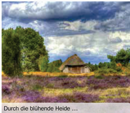
Durch die blühende Heide ...

orten über Köln, Bielefeld und Hannover nach Celle . Hier legen Sie die Mittagspause ein. Über Uelzen geht es am Nachmittag weiter nach Hitzacker in Ihr Hotel.