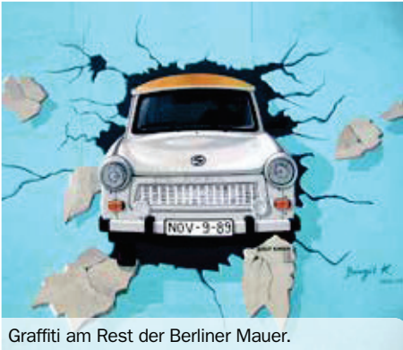
Graffiti am Rest der Berliner Mauer.