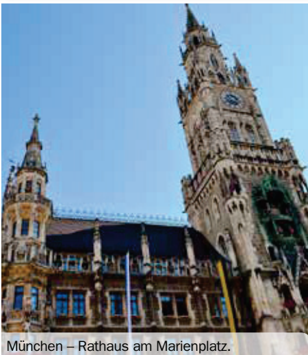
München – Rathaus am Marienplatz.