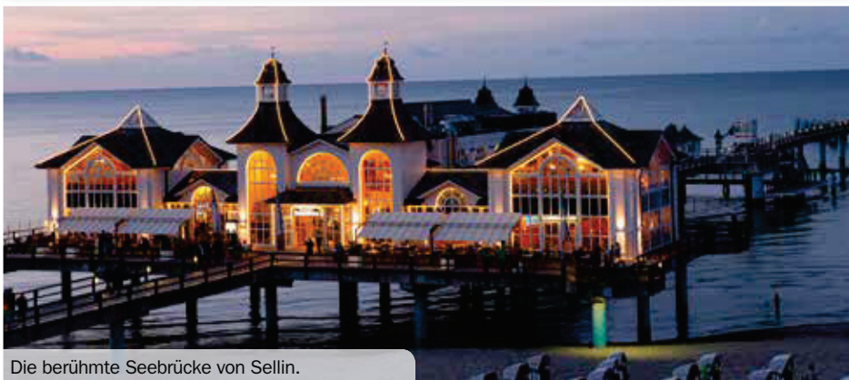
Die berühmte Seebrücke von Sellin.