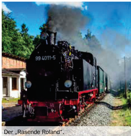
Der „Rasende Roland“.