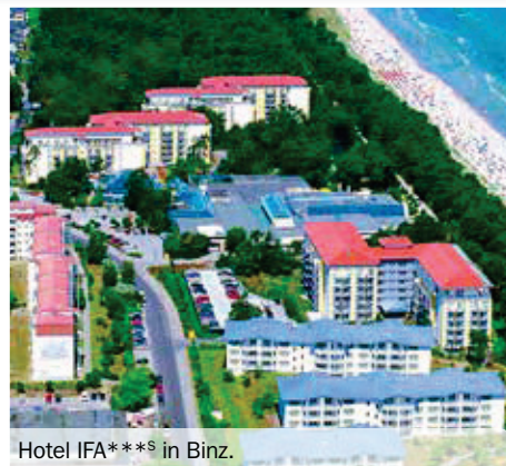
Hotel IFA***S in Binz.