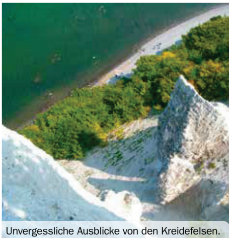
Unvergessliche Ausblicke von den Kreidefelsen.